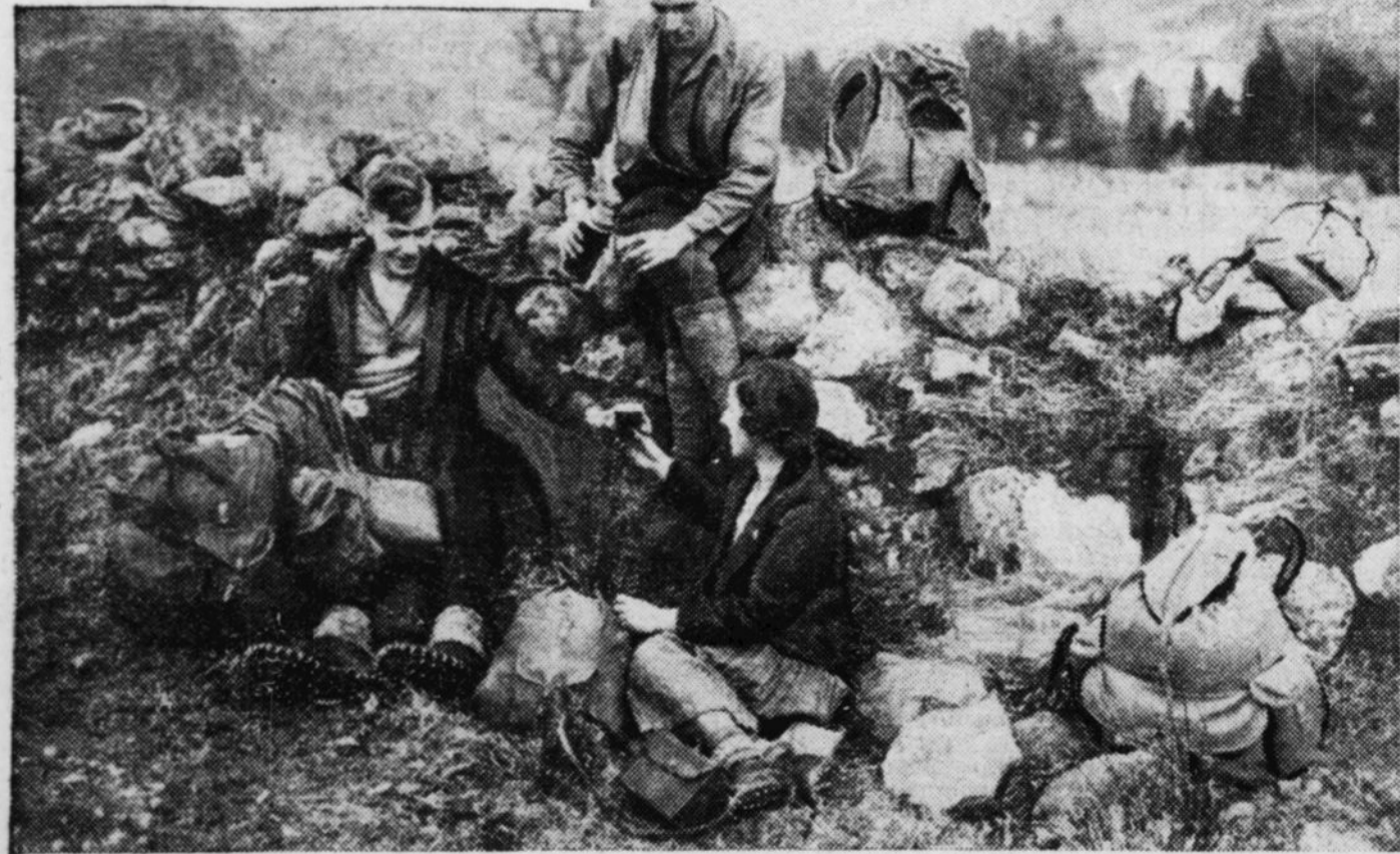
UN CAMP ORGANISÉ. — Le transport du canoë à pied sec. — L'excursion en montagne.