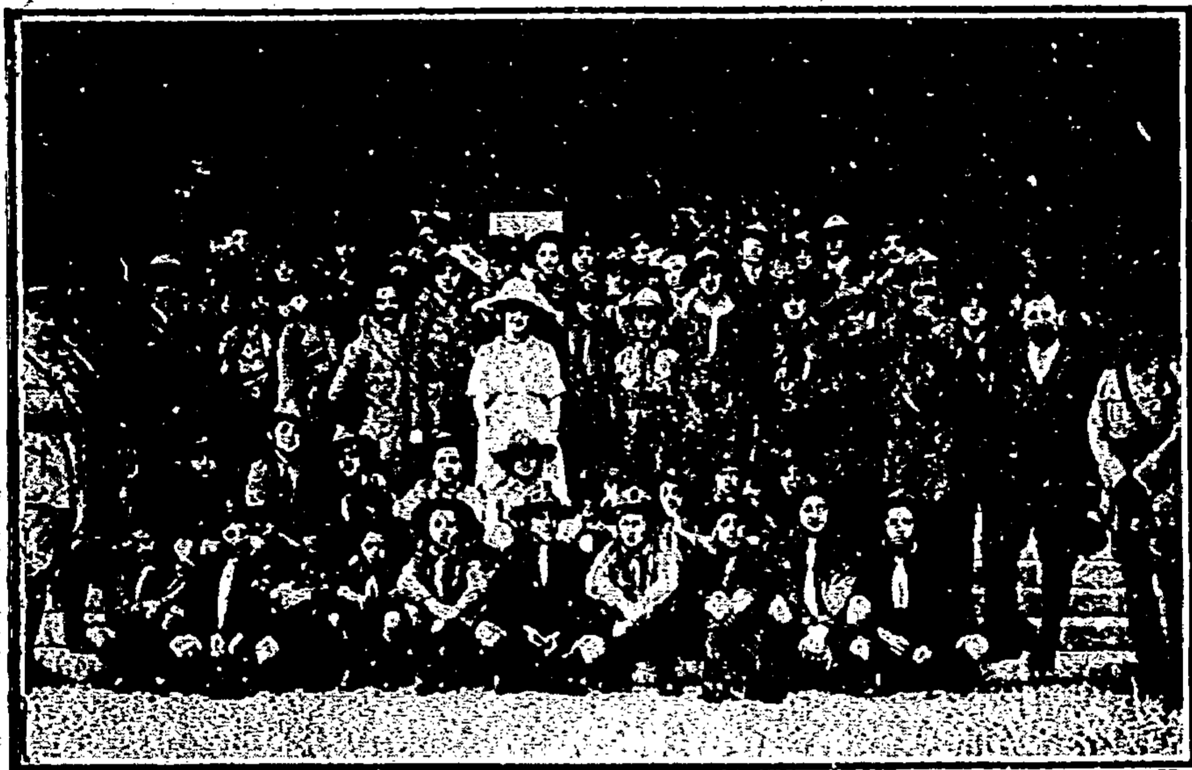
Les Eclaireurs à l'Elysée. — Mme R. Poincaré au milieu d'un Groupe d'E. U. et d'E. de F. qu'elle avait invités à goûter.

Le Mouvement des Eclaireurs. — Le mouvement a été lancé en Angleterre, en 1908, par le géné-